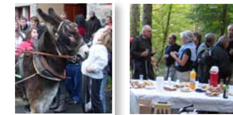
Animations à Chanteuges page 2 et 3