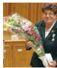
Deux médailles remises à Chanteuges page 4

Suite des travaux l'aménagement du Prieuré page 2