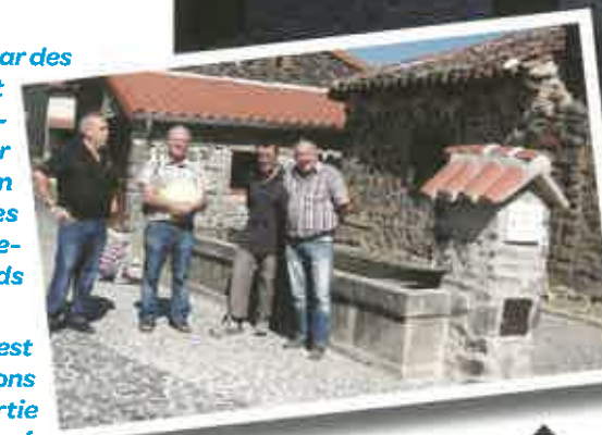
Réception chantier