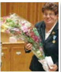
Deux médailles remises à Chanteuges page 4

Suite des travaux l'aménagement du Prieuré page 2