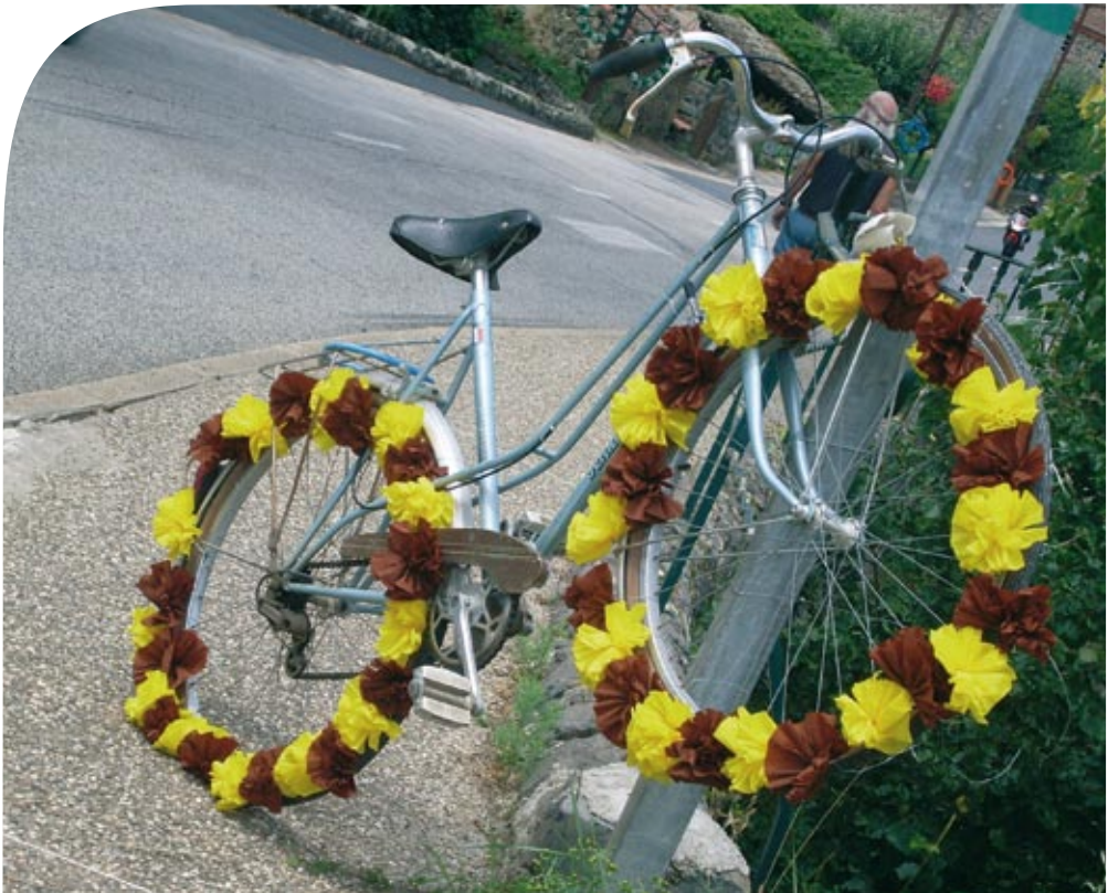
Sur le passage de la Pierre Chany, des vélos fleuris à Chanteuges