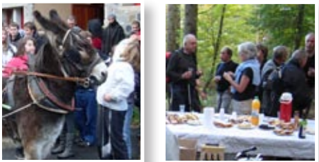
Animations à Chanteuges page 2 et 3

Pour notre réseau communal, nos agents sont toujours à pied d'œuvre dès que nécessaire pour assurer, le mieux qu'il se peut, le déneigement de nos petites routes.