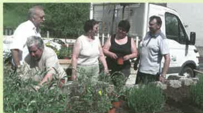
L'équipe municipale chargée du fleurissement en action.

Nous ne souhaitons pas couvrir la commune de fleurs, ayant à cœur de ne pas engager de frais inconsidérés et limiter le plus possible l'usage de produits phytosanitaires. Le prix spécial de la « mise en valeur de l'espace communal rural » nous a été attribué pour l'aménagement de la place de Cantheugeol.