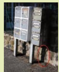
Quelques exemples de dysfonctionnement