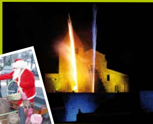
Les feux d'artifice offerts par la commune en juillet.