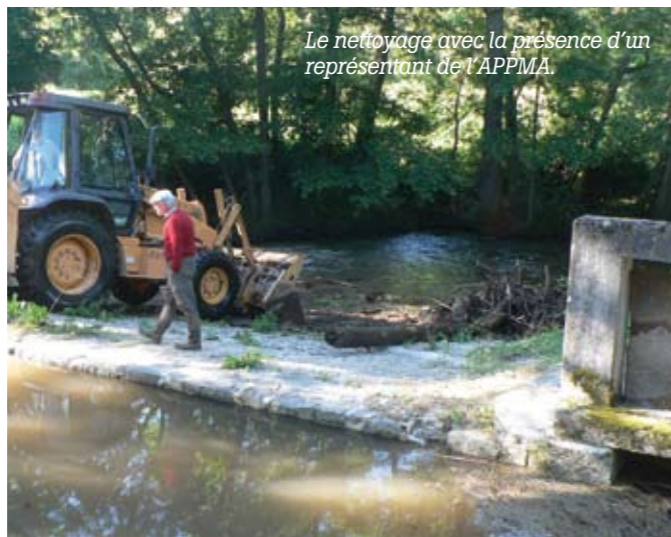
Le nettoyage avec la présence d'un représentant de l'APPMA.