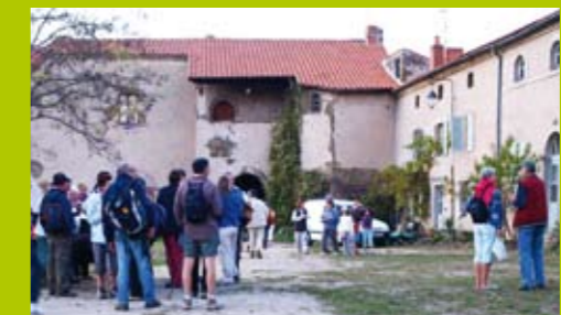
L'arrivée de la Rando des feuilles mortes, encore un grand succès sous le soleil d'automne!

Un tel travail d'animation ne se fait pas sans l'appui de tous ces membres dévoués qui gravitent autour du bureau, c'est pourquoi il ne faut pas oublier de les féliciter et de les remercier.