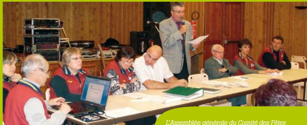
L'Assemblée générale du Comité des Fêtes