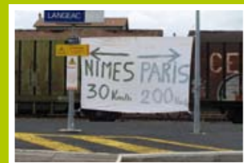
Le 28 octobre 2008 à la Bastide et le 29 novembre 2008 à Langeac, manifestation des élus et de la population pour le maintien du service ferroviaire entre Paris et Nîmes.